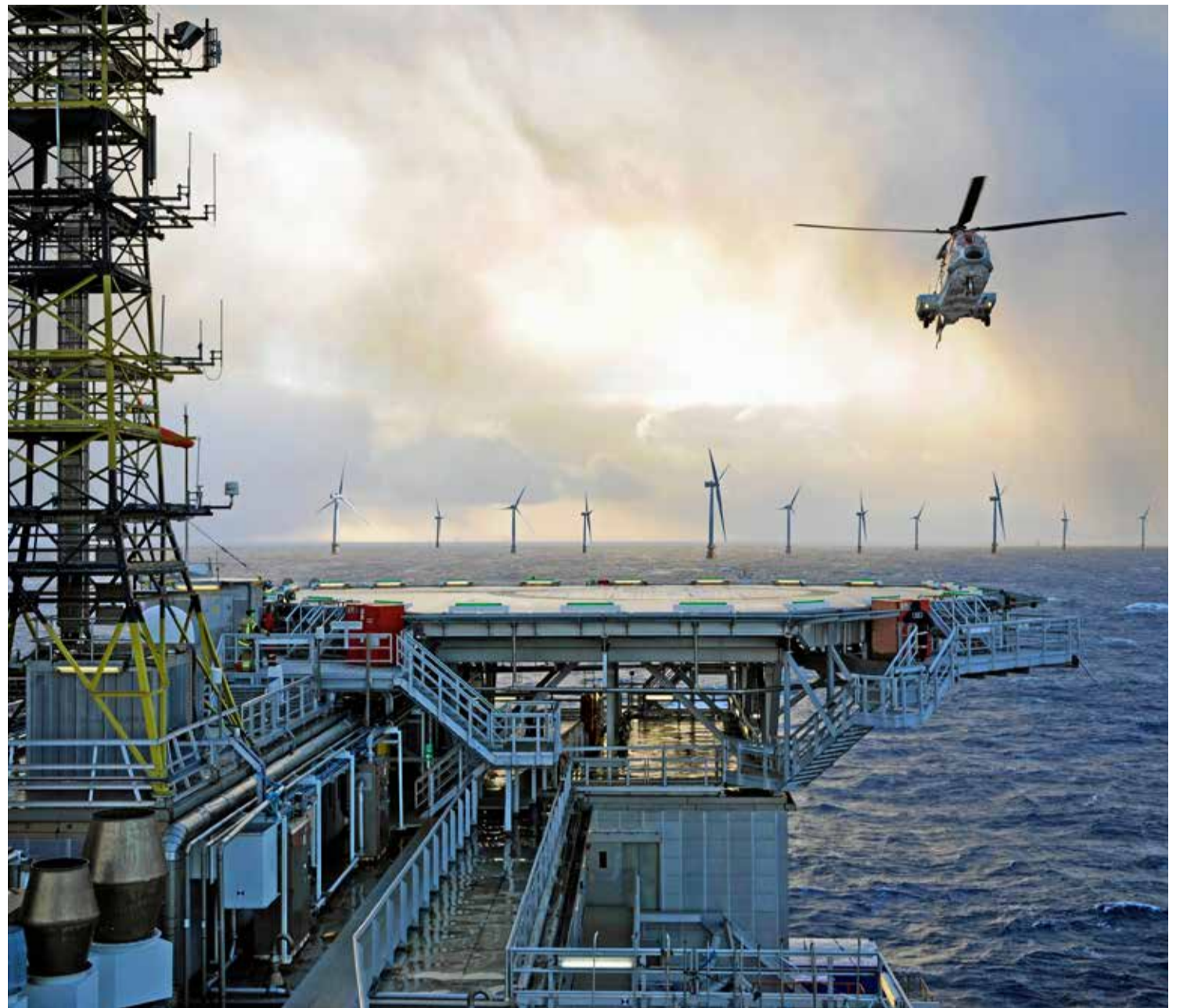
Pioneering scheme: Equinor's Hywind Tampen floating wind farm