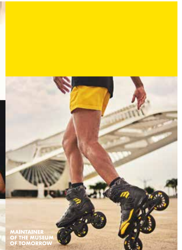
MAINTAINER OF THE MUSEUM OF TOMORROW