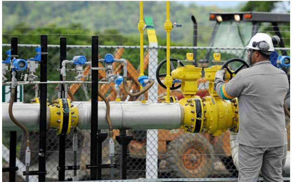
Expansion drive: a Petrobras worker at a gas pipeline station

"Key to achieve this is more transparency to support and attract operators who believe in this market," Rodrigues said.