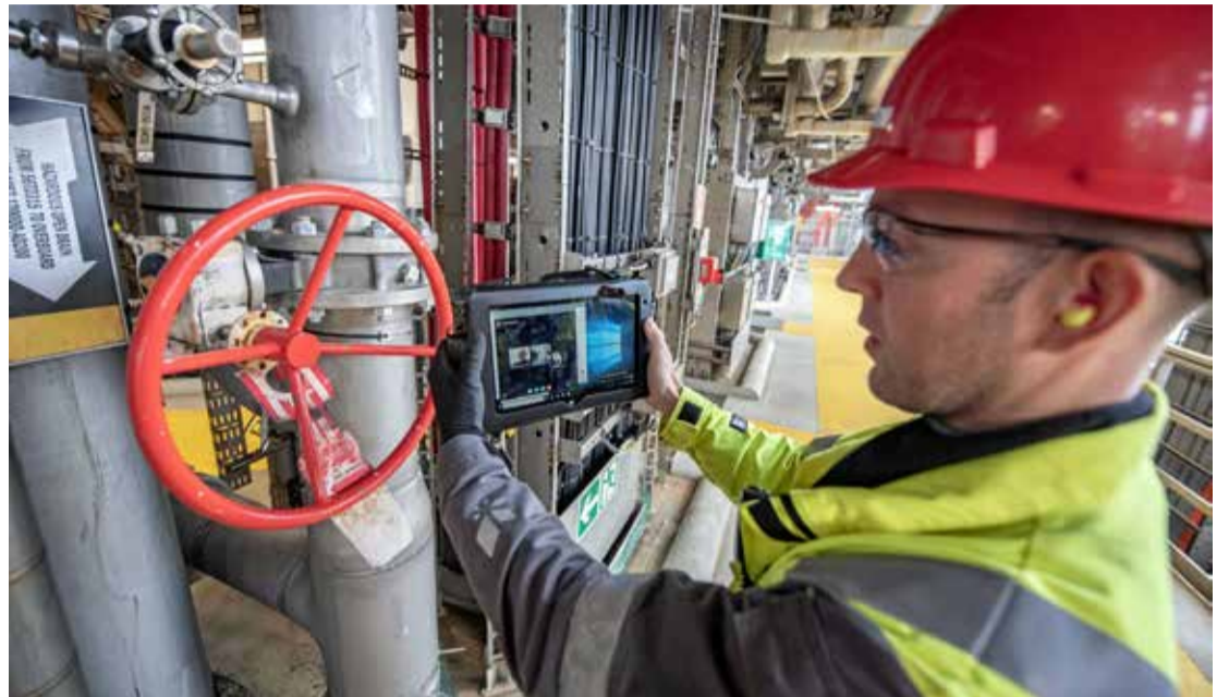
Screen shot: Equinor uses digital technology at its Mariner installation