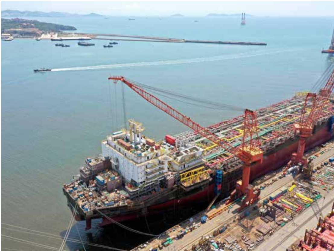
Spotlight: the Carioca FPSO under construction at Cosco Shipping Heavy Industry in China earlier this year